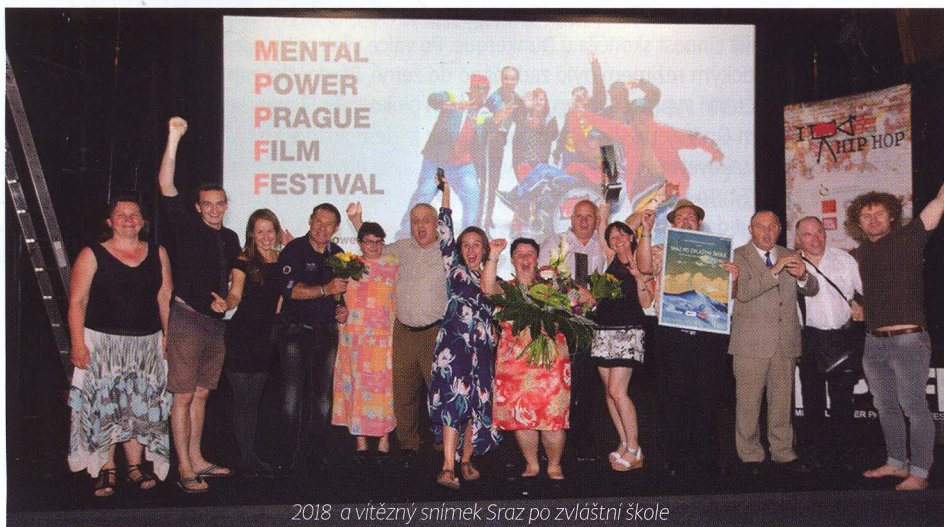
2018 - vítězný snímek Sraz po zvláštní škole