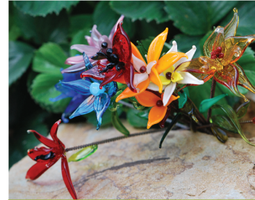
výtvarná a sklářská dílna

Domov pod hradem Žampach, Žampach 1, 564 01 Žamberk www.uspza.cz