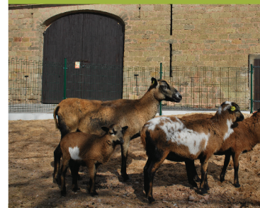
chov domácích zvířat