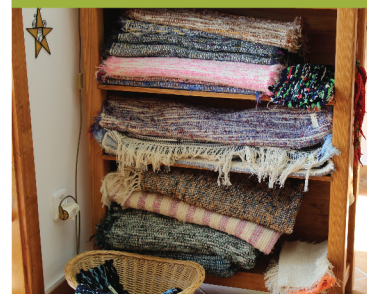
tkalcovská a šicí dílna