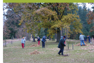
pomocné práce při údržbě Arboreta Žampach