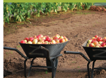
pomocné hospodářství zahrad