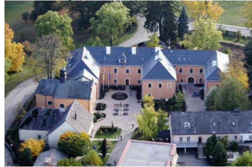
Záměcká budova po rekonstrukci, r. 2008

V roce 2005 byl dokončen nový areál Domků ve stráni Žampach pro 22 obyvatel (mužů a žen) a pro nová aktivizační centra. Jako investice Pardubického kraje cca 30 mil Kč.