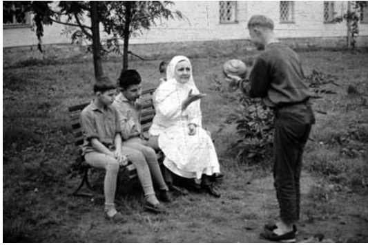
Archivní fotografie, r. 1970

Zařízení bylo zřízeno jako státní Ústav sociální péče pro mládež Žampach v roce 1967 přeměnou ze zařízení Domov důchodců České katolické charity. Do roku 1985 zde pracovaly sestry sv. Vincenta společně s „civilními“ zaměstnanci.