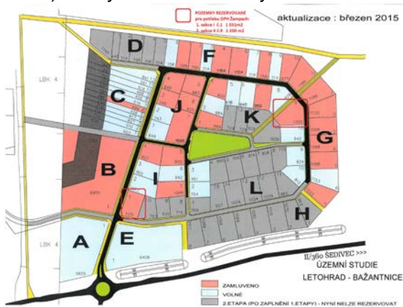
pozemky v lokalitě Letohrad Nad Bažantnicí

Součástí nezbytných předběžných kroků v rámci 1. transformační etapy je také realizace záměru pořízení 2 pozemků v lokalitě Letohrad Nad Bažantnicí , do majetku Pk a následně také příprava příslušného investičního záměru Pk na výstavbu dvou domků, kde by měly být umístěny 4 domácnosti (celkem pro 12 uživatelů) služby DOZP a CHB. Výstavba domků by měla být zahájena ve 2. polovině roku 2017.