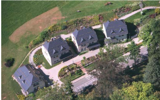
Domky ve stráni Žampach, r. 2005

V roce 1993 ústav získal právní subjektivitu (původně začleněné zařízení Okresního ústavu sociálních služeb), nejprve jako příspěvková organizace Města Letohrad, později Okresního úřadu Ústí nad Orlicí a nakonec se ústav od roku 2003 stal zařízením - příspěvkovou organizací Pardubického kraje.