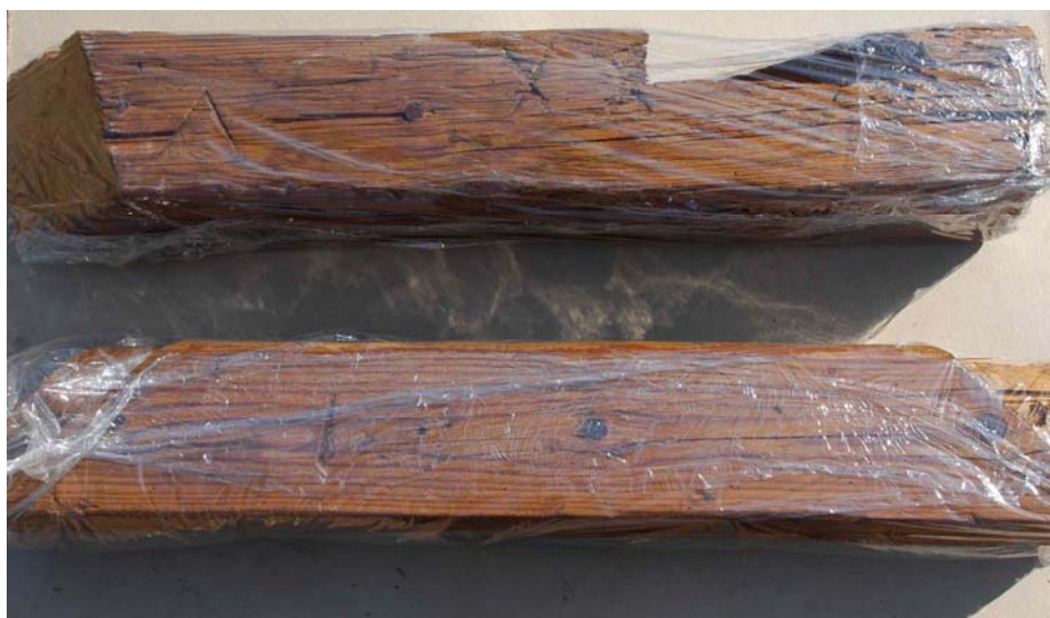
Stav před transportem

Při renovaci prvků byla maximálně respektována jejich autenticita se všemi stopami vlivu historického vývoje. V tomto směru jde o unikátní informace o dnes již neexistujícím, původním stavu objektu.