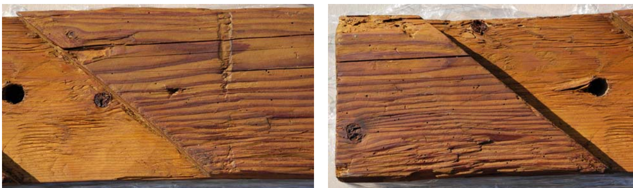
Stav po úpravě a konzervaci povrchu

Po dokonalém vyschnutí byl povrch ještě opatřen konzervační vrstvou včelího vosku.