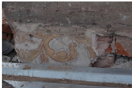
Malba, odhalená na komínovém tělese při bourání stropů