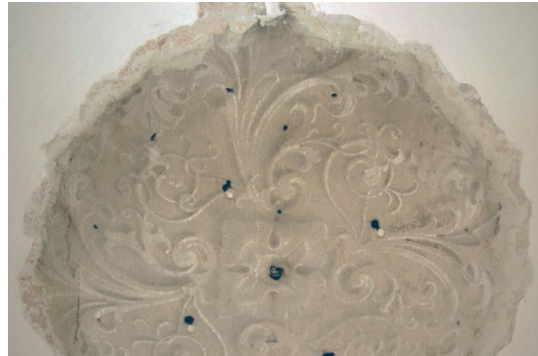
Malba, odhalená na stropě pod sádrovou růžicí