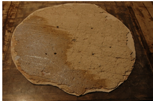
Transferované díly- rubové strany po očištění