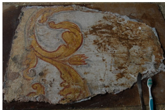
Zpevněné transfery po odstranění stabilizačních přelepů