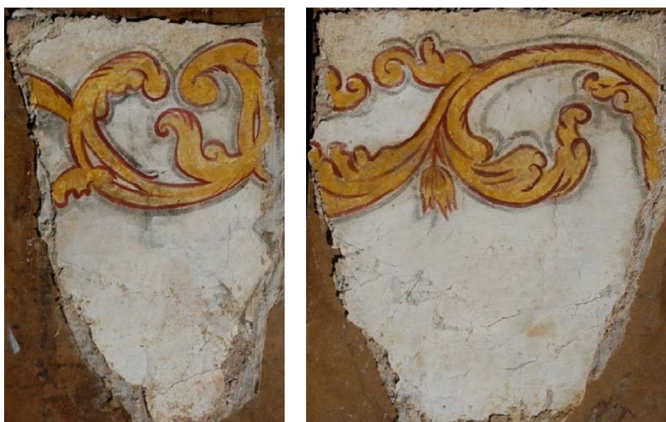
Stav po očištění povrchu