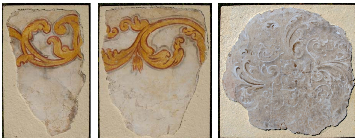
Stav po osazení jednotlivých dílů na přenosné panely