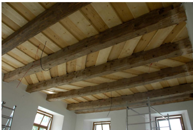
Strop před zahájením práce

Šárka a Petr Bergerovi akad.mal.a restaurátoři 2008