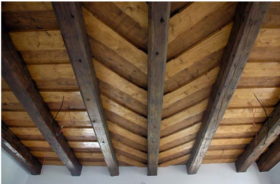
Strop po ošetření a barevném tónování