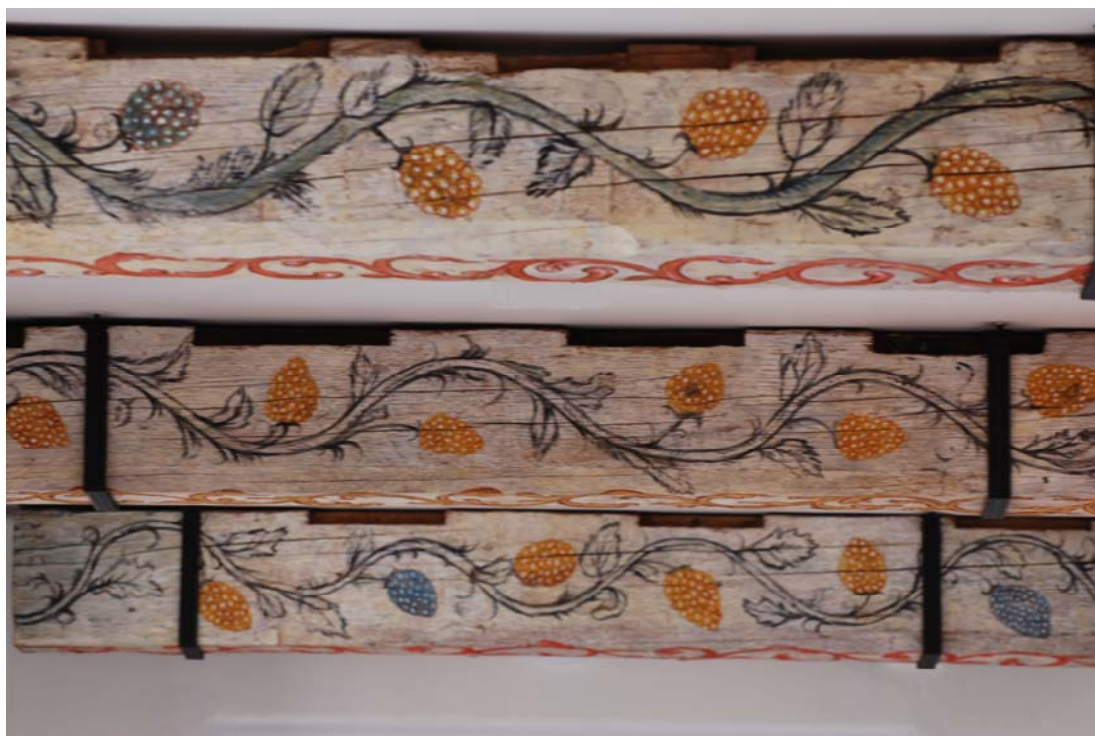
OBNOVENÉ PANÁTKOVĚ CENNÉ PRVKY (trámy na chodbě)