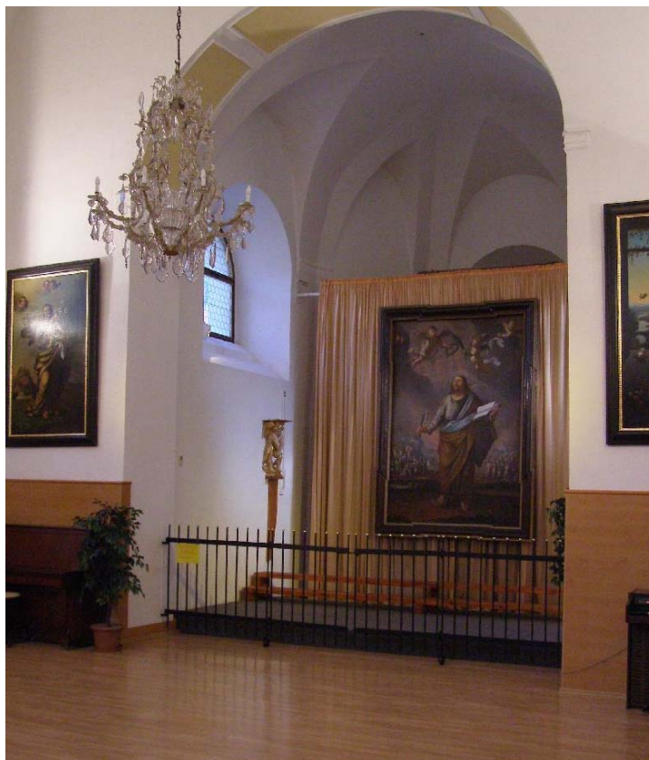
KAPLE SV. BARTOLOMĚJE