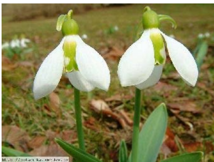
Galanthus elwesii – sněžěnka Elwésova