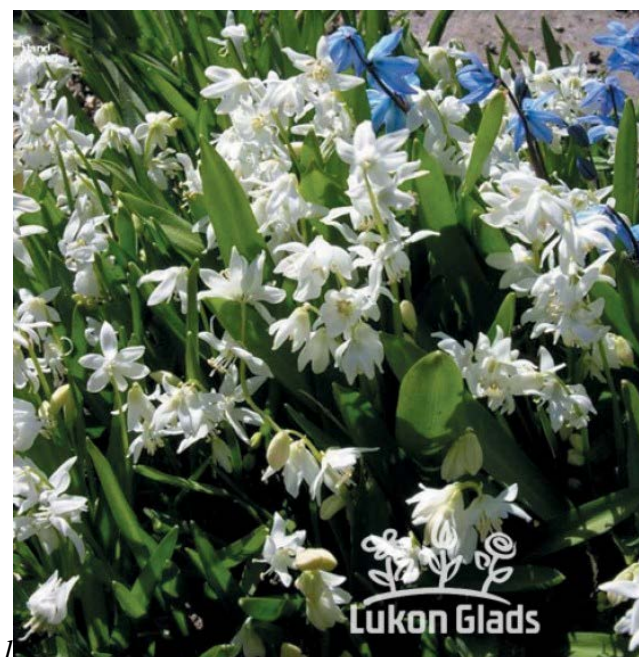
Scilla sibirica alba - ladoňka