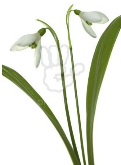
Galanthus woronowii -