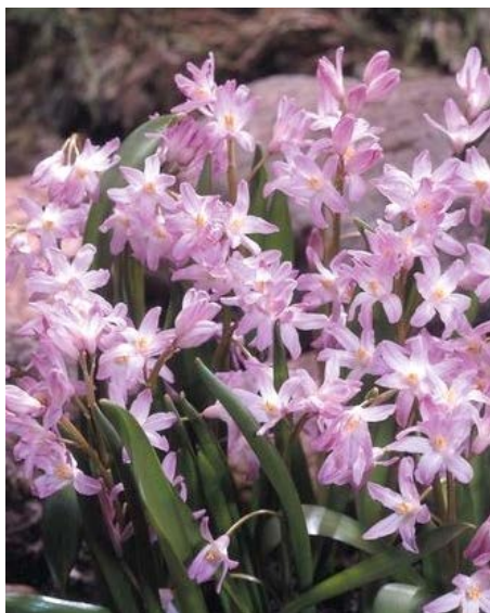
Chionodoxa "Pink Giant" – ladonička růžová