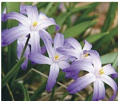
Chionodoxa sardensis - ladonička sardská