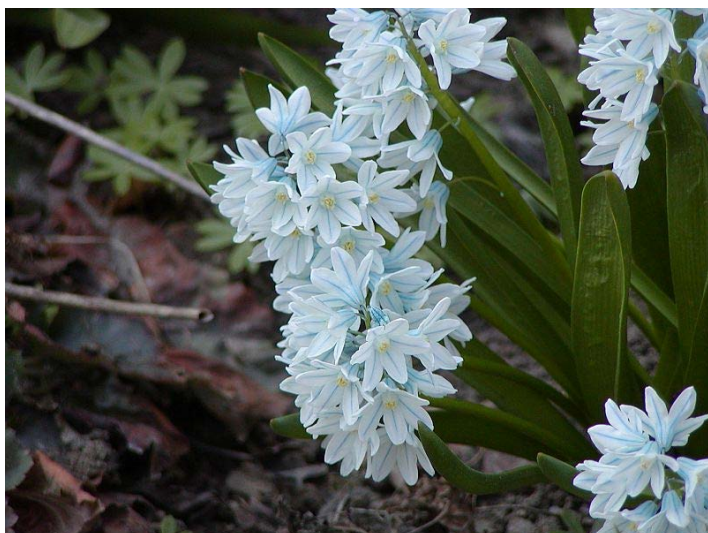
Puschkinia libanotica – puškinie ladoňkovitá