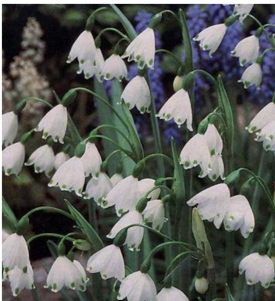
Leucojum aestivum - bledule letní