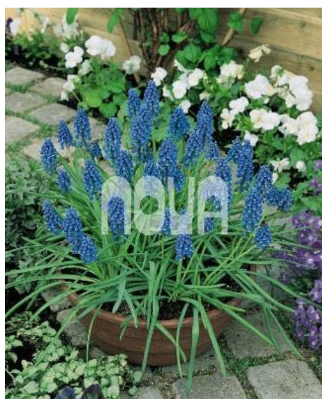
Muscari Blue Pearl – modřenec arménský