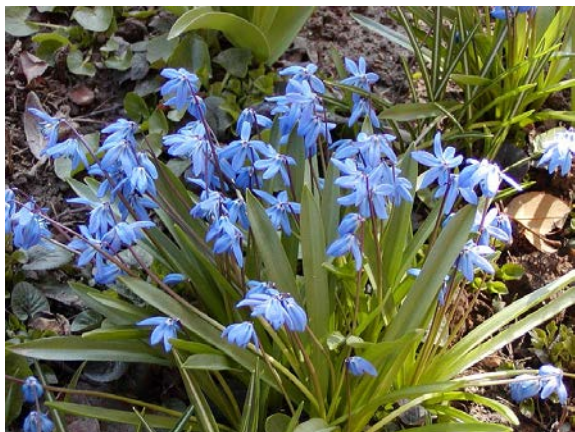
Chionodoxa luciliae - ladonička bělomodrá