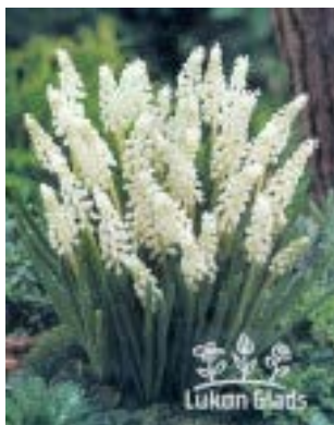
Muscari botryoides album - modřenec