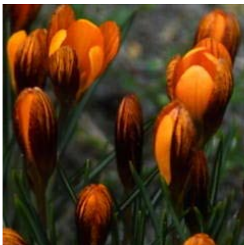
Crocus Zwanenburg Bronze