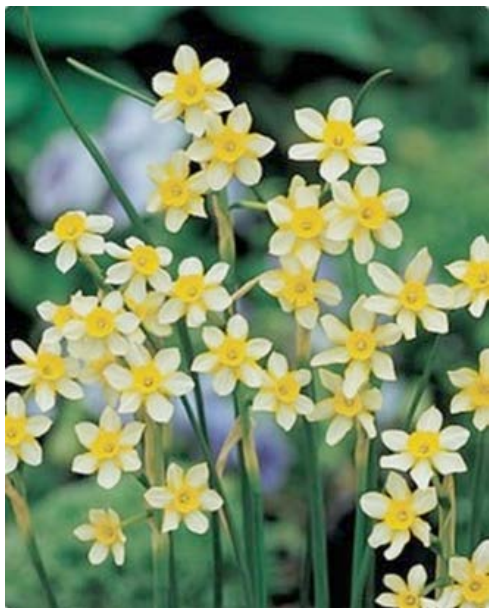
Narcissus Jonquilla 'New Baby'