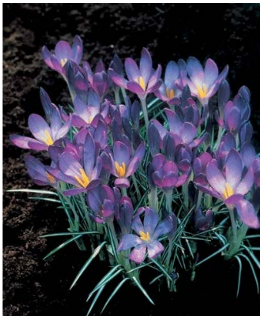
Crocus Whitewell Purple