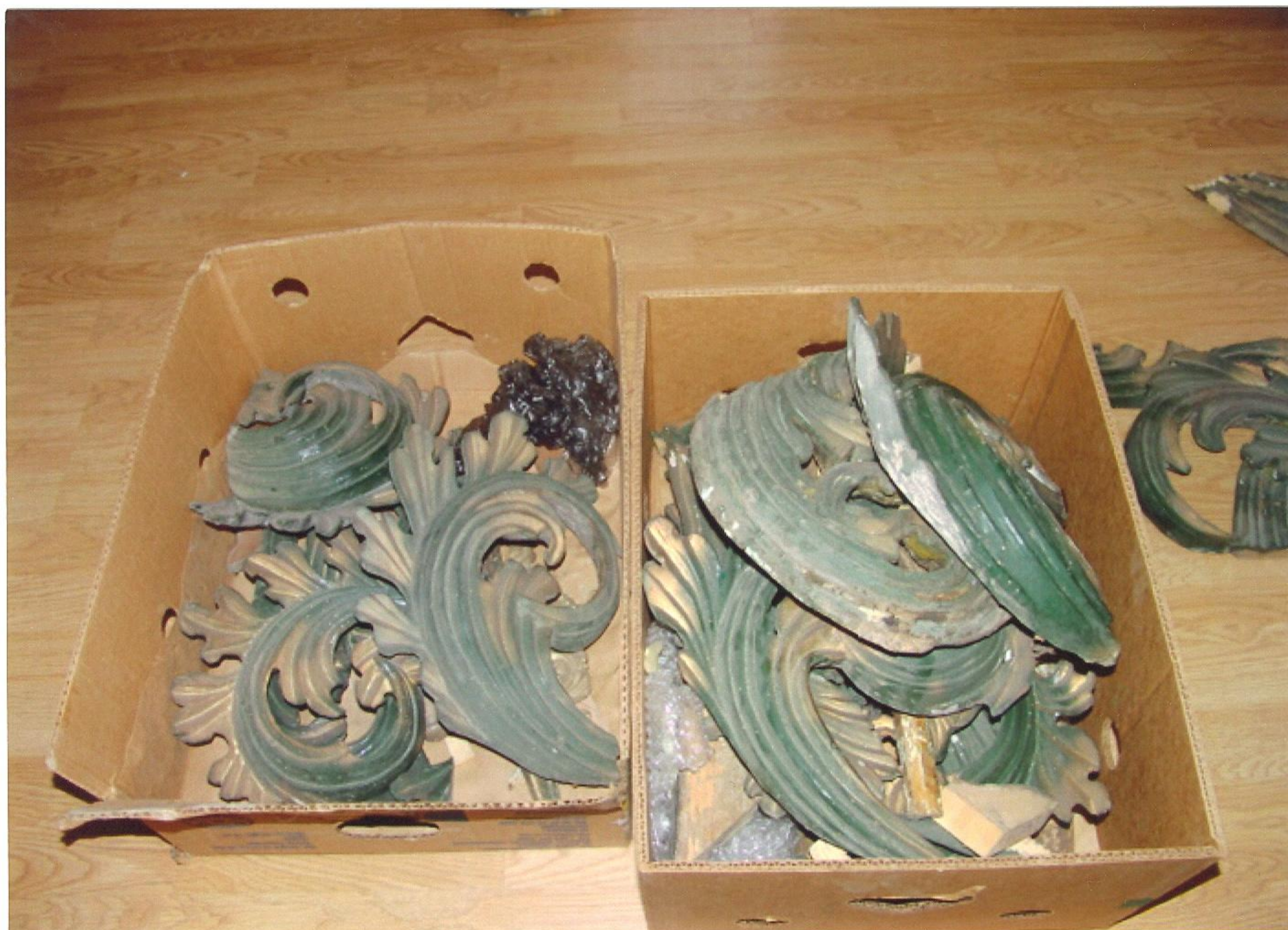
Rozebrané části ozdobného rámu