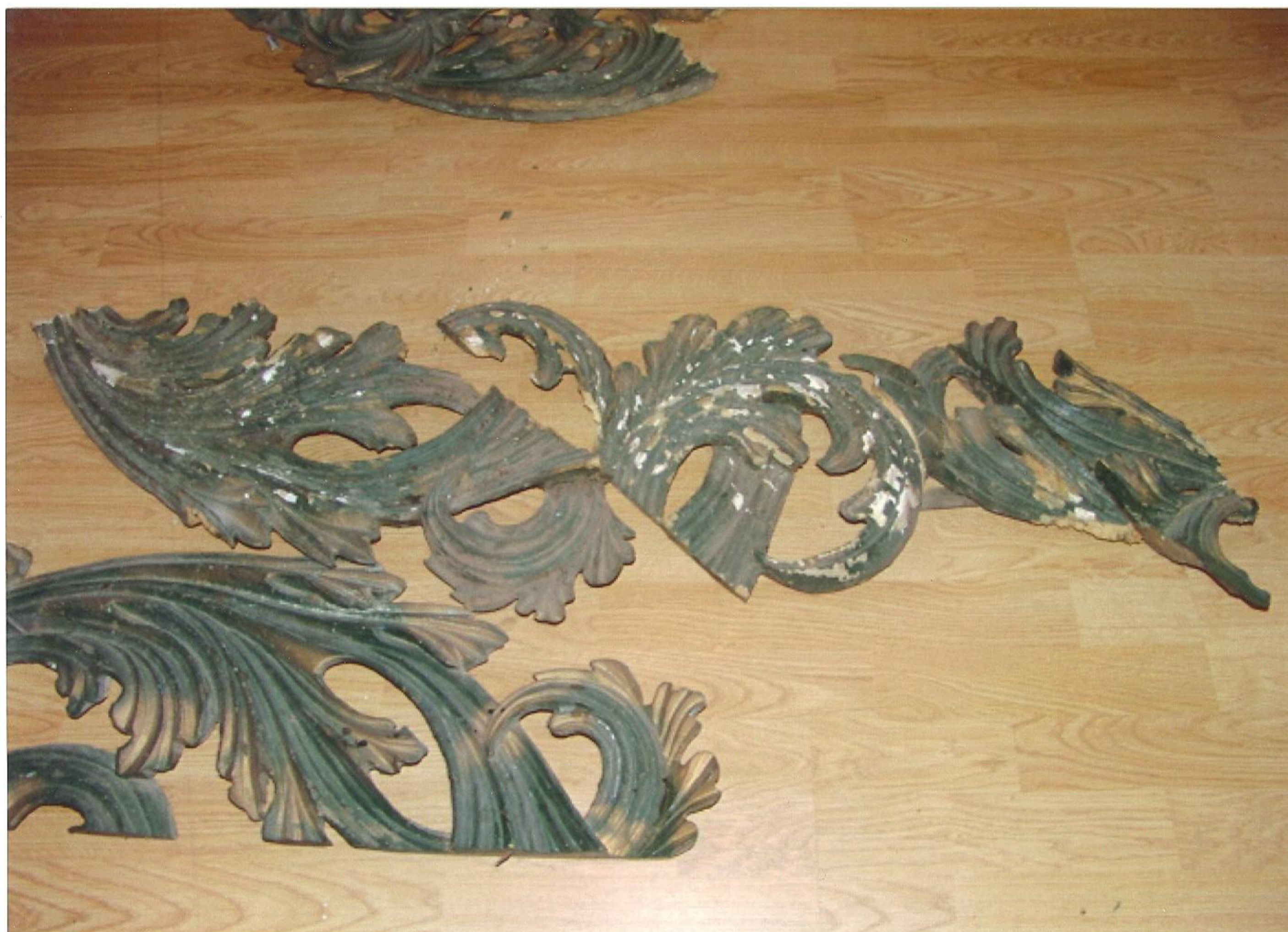
Rozebrané části ozdobného rámu