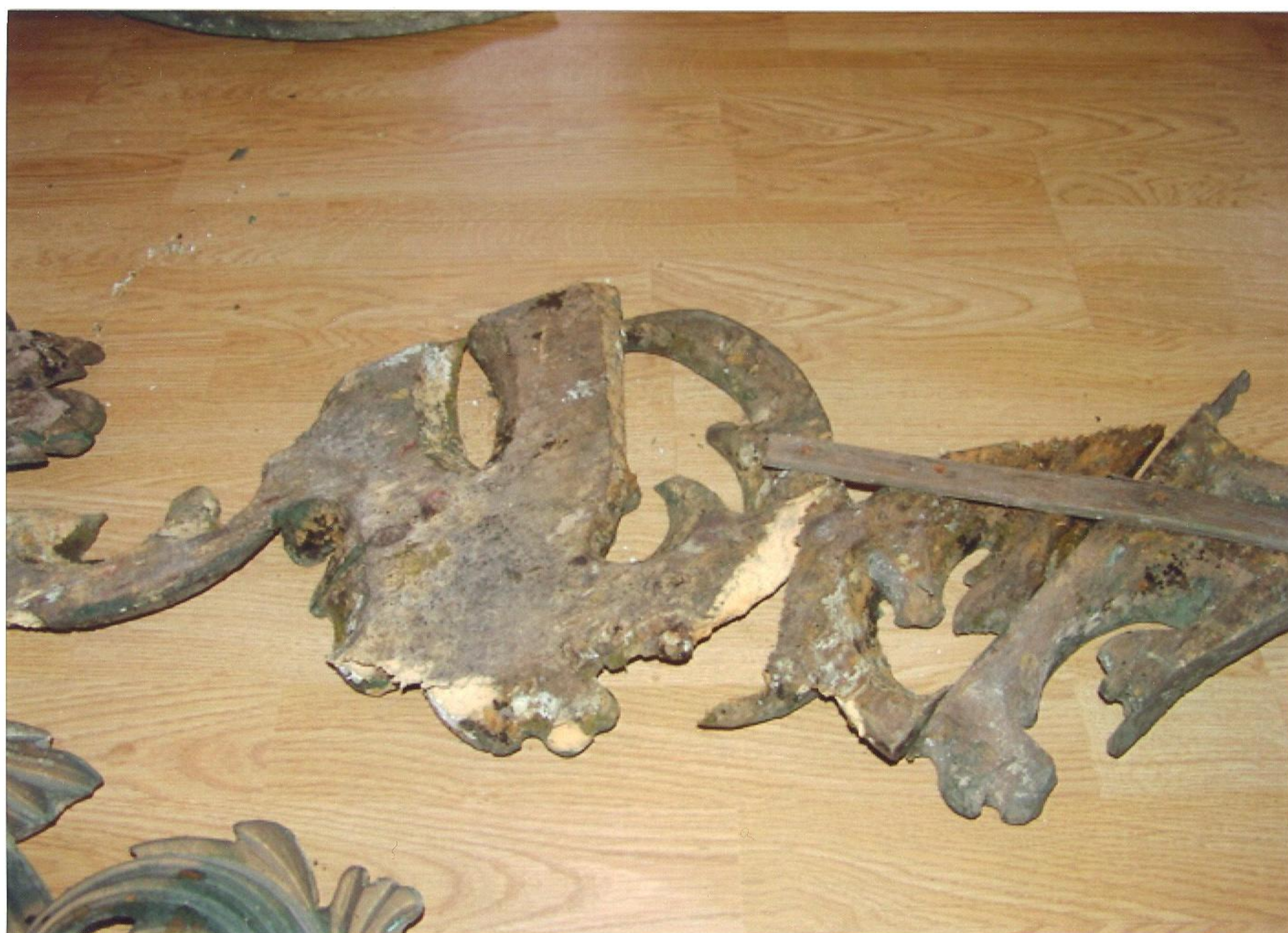
Zlomky částí ozdobného rámu