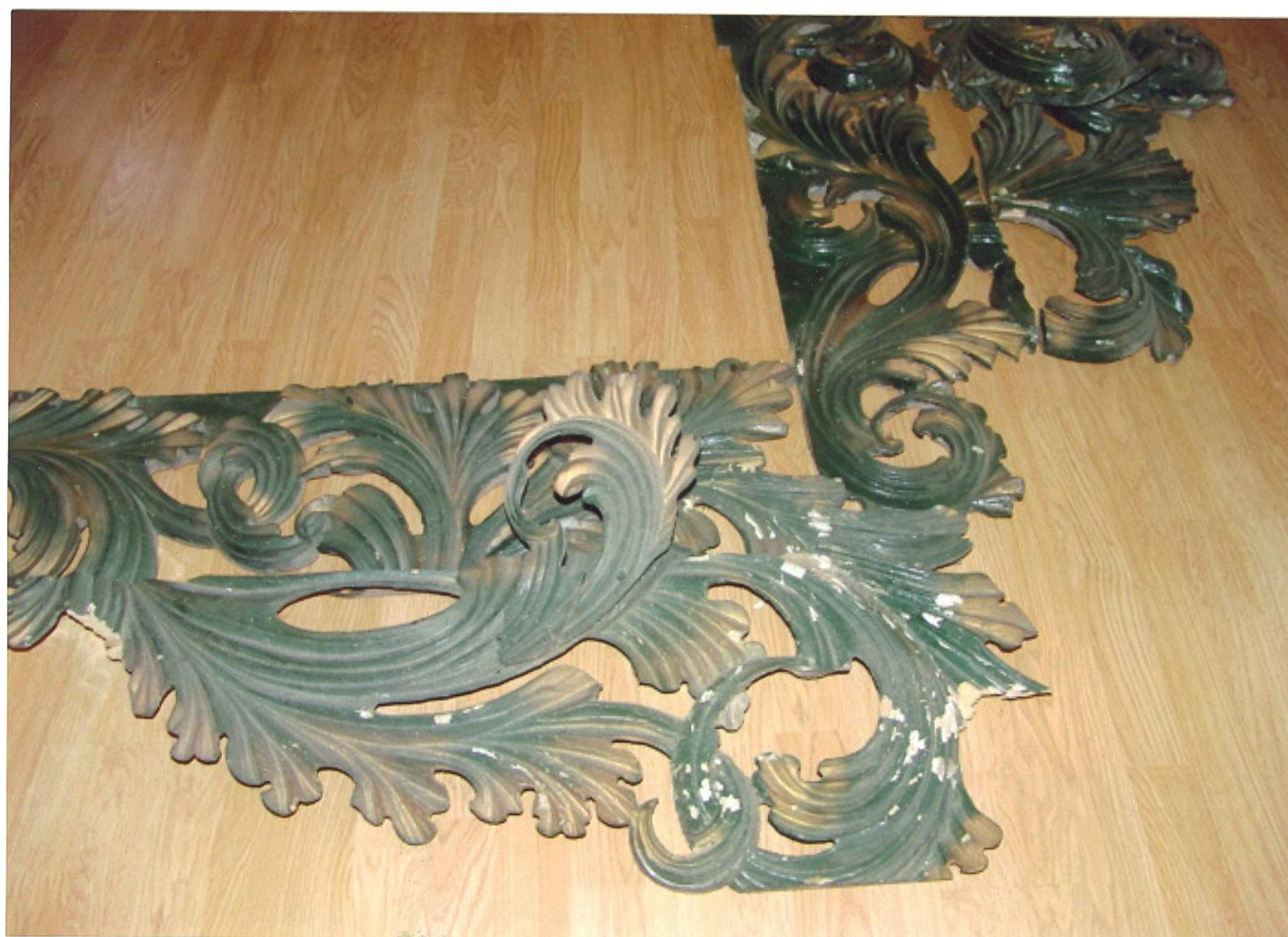
Rozebrané části ozdobného rámu