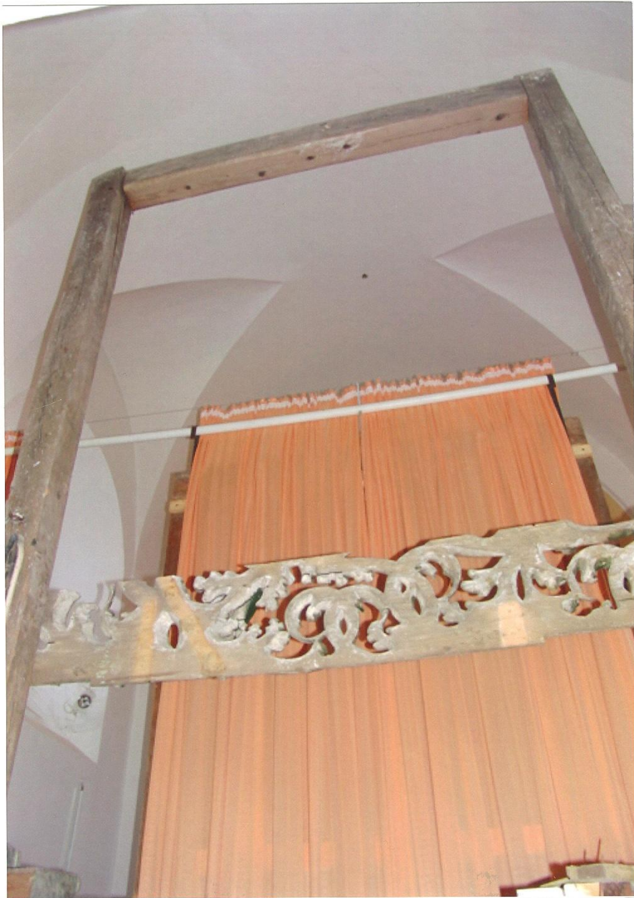
Zadní strana trámové konstrukce