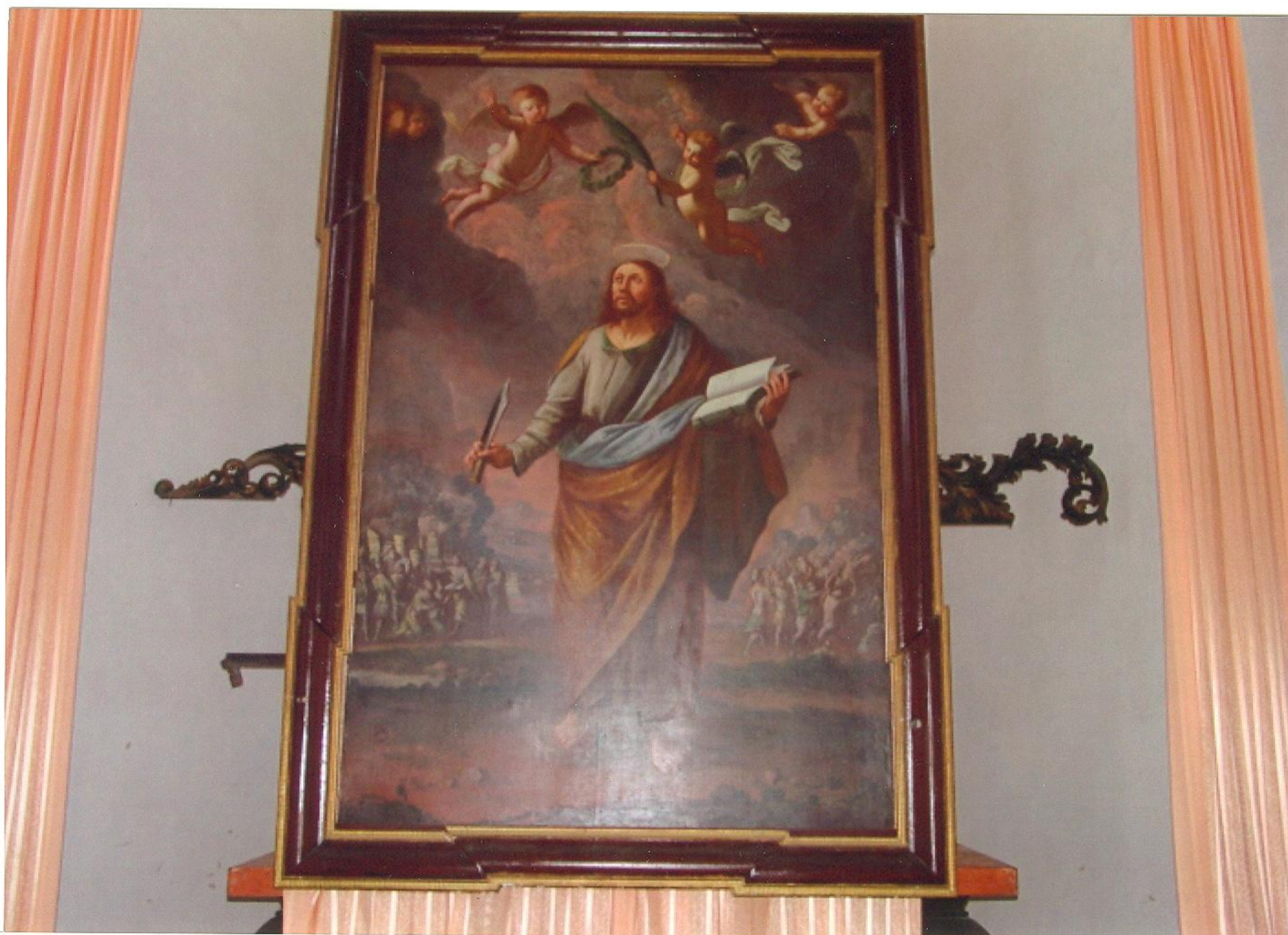
Instalovaný zrestaurovaný obraz, ozdobný rám před restaurováním