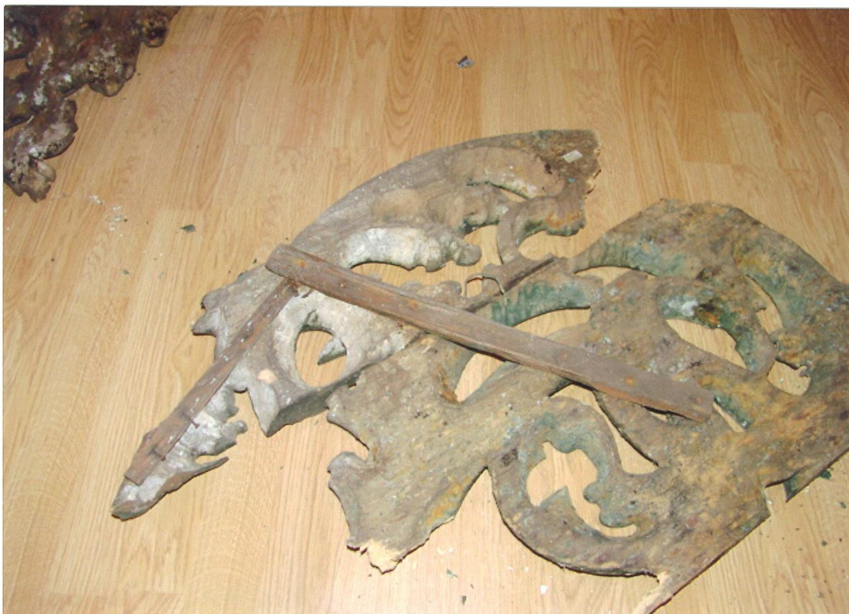
Rubové strany destruovaných fragmentů řezeb