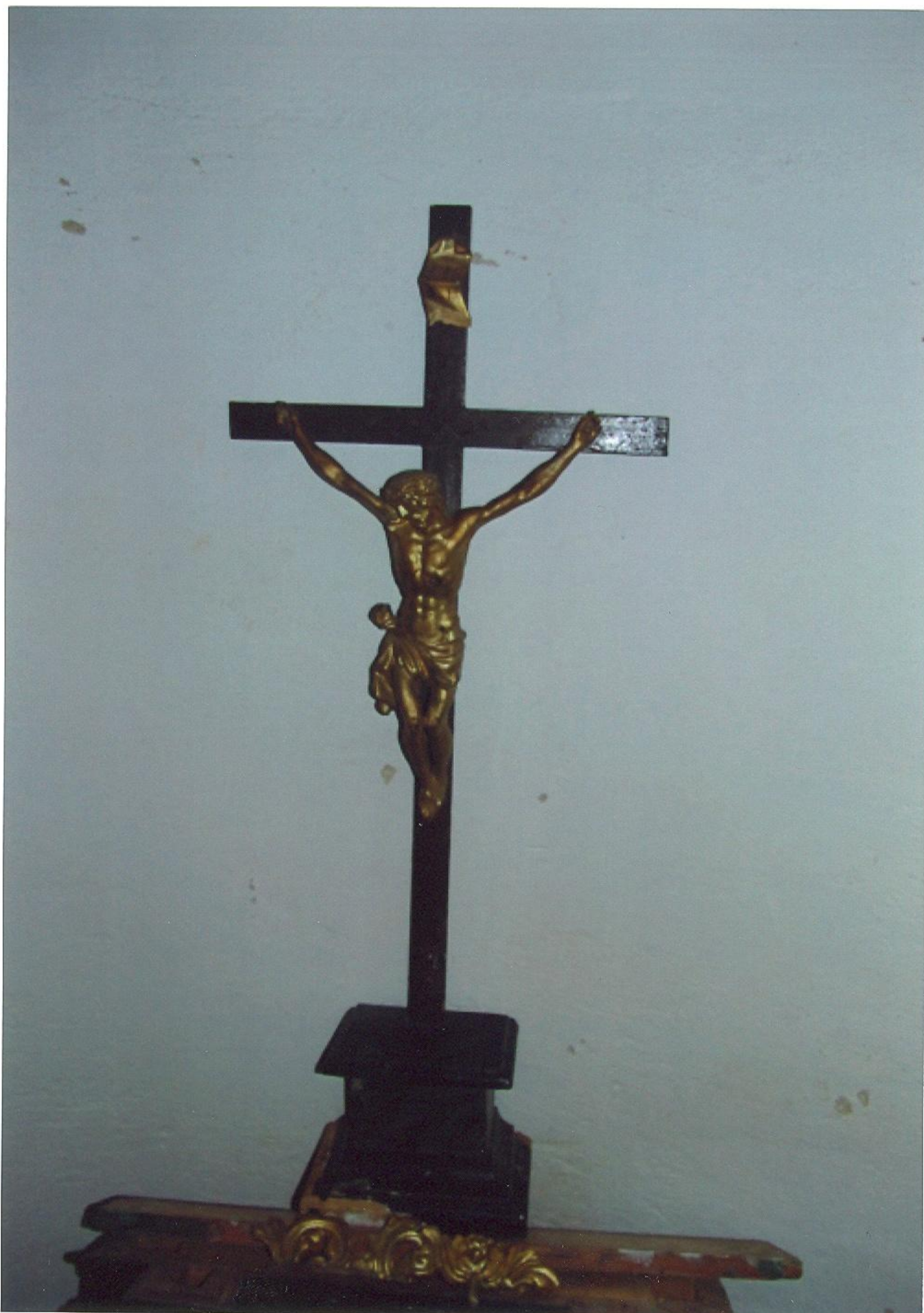
Kříž na svatostánku