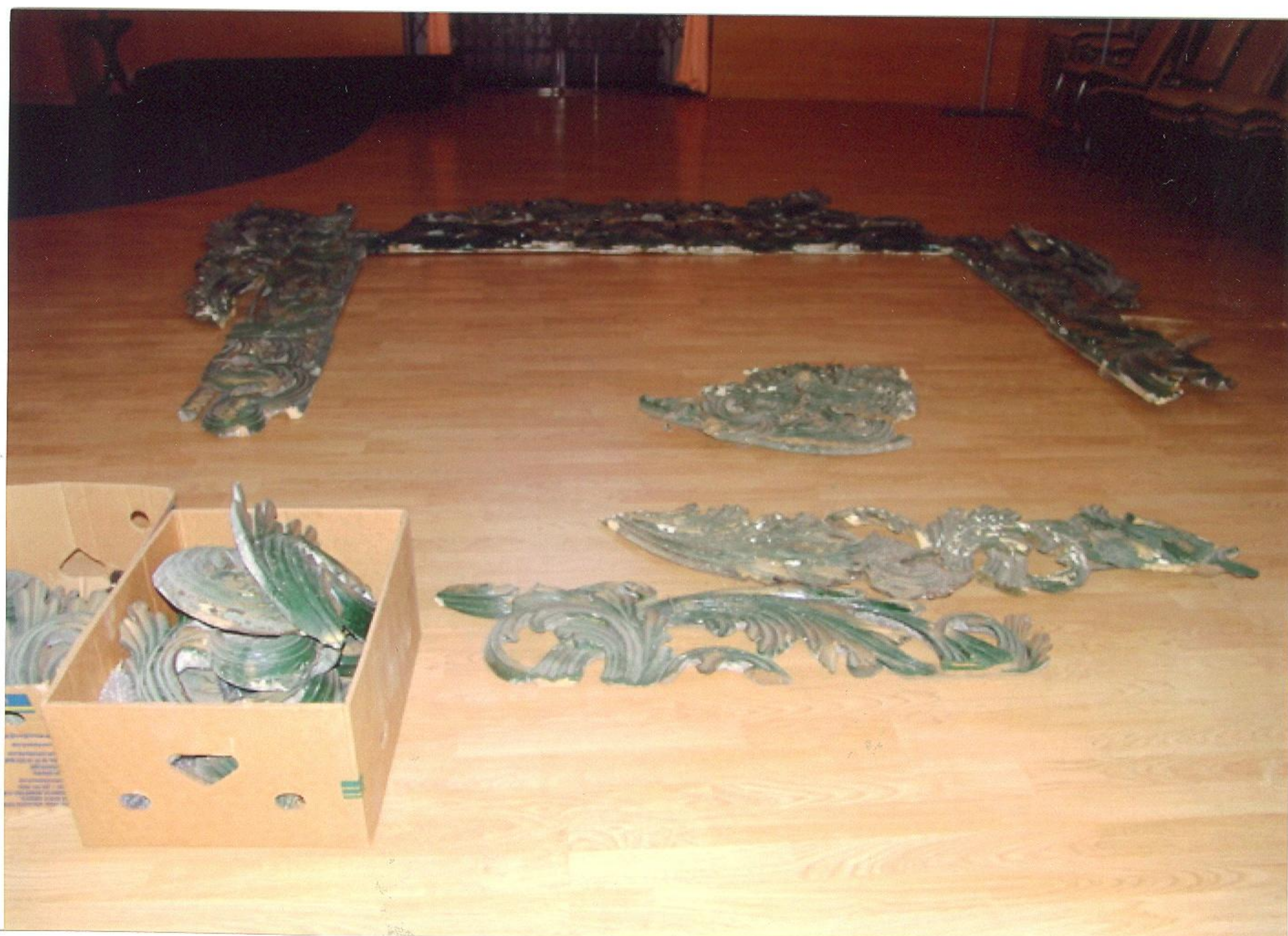
Sesazená část ozdobného rámu