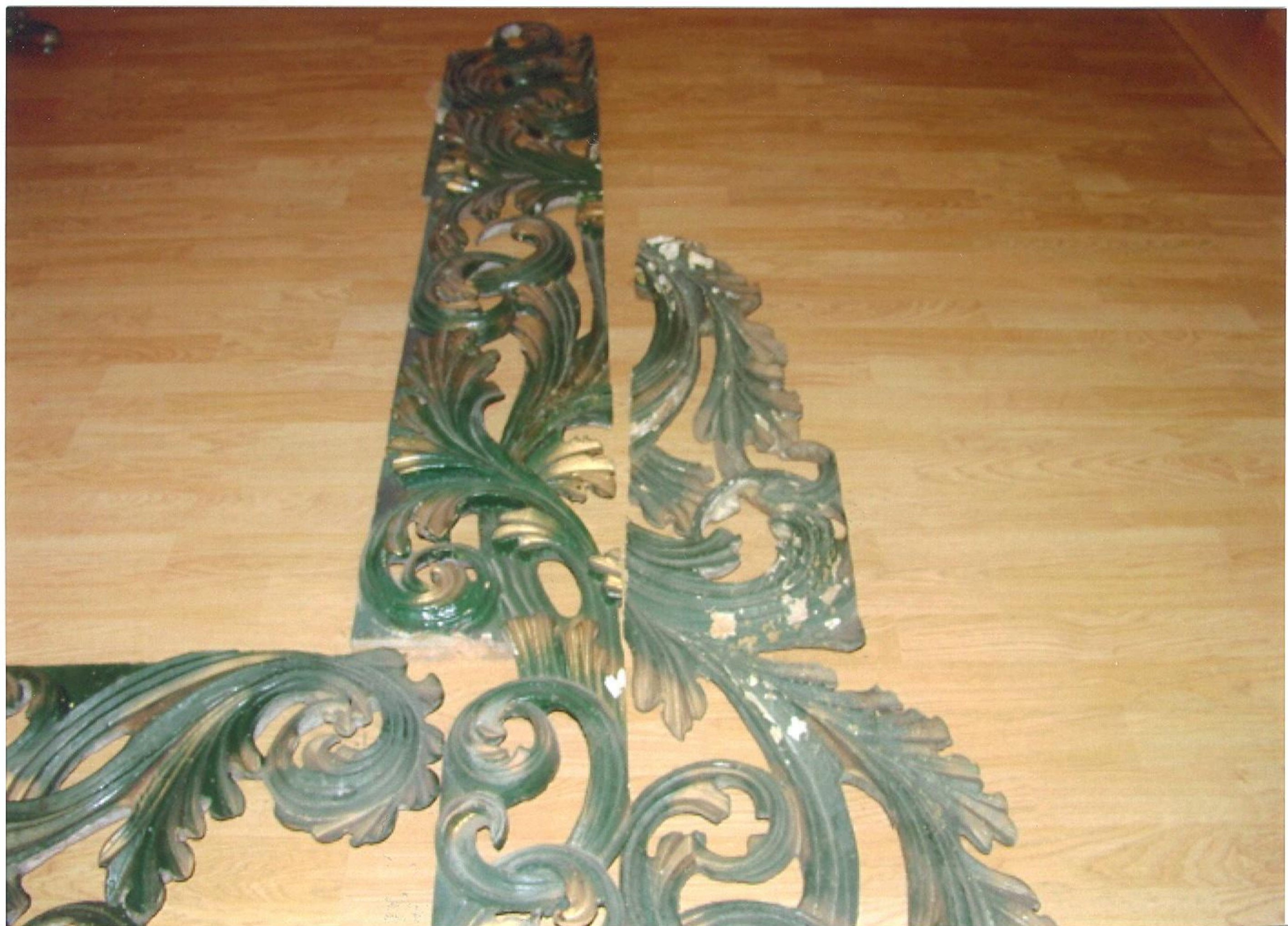
Rozebrané části ozdobného rámu