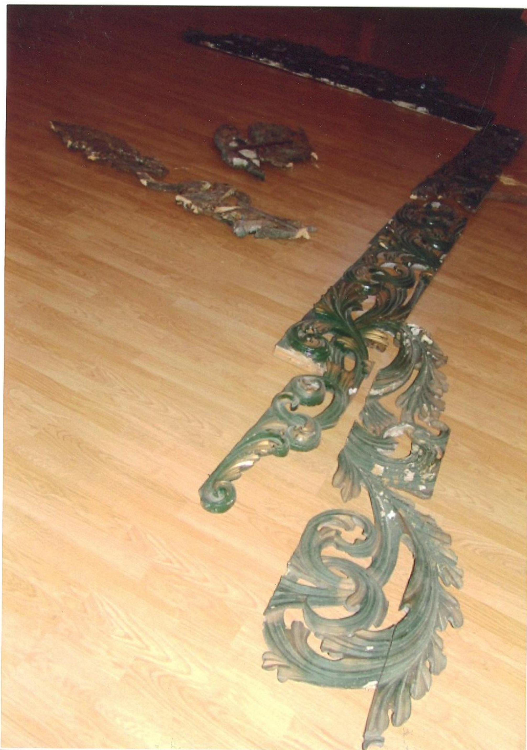
Sesazená část ozdobného rámu