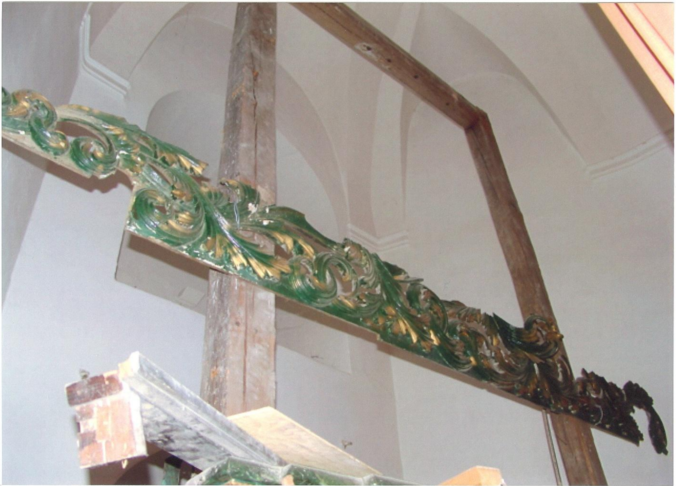
Lícová strana trámové konstrukce, horizontálně provizorně upevněna část zdobeného rámu