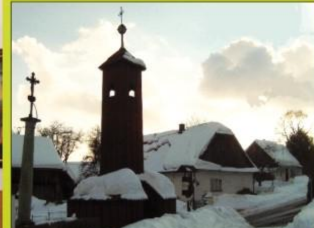
ROUBĚNÉ CHALUPY A DŘEVĚNÁ ZVONÍČKA z přelomu 18. a 19. století.