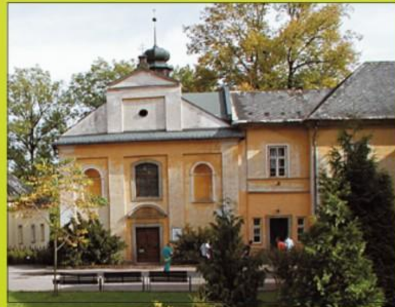
ZÁMEČKÁ KAPLE Nehodnotnější částí zámečského komplexu je barokní kaple sv. Bartoloměje z roku 1701. Spolu s částí raně barokního zámku na Žampachu. Její střešní je zakončena drobnou věžičkou s cibulovitou bání. V roce 1992 byla provedena rekonstrukce kaple včetně výměny věže, střešní a stropu kaple. V interiéru se nachází rozvilinový oltář je sestaven z vyřezávaných prvků barokního oltáře kolem r. 1700.