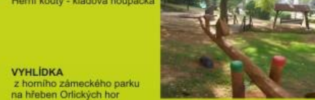
HERNÍ KOUTKY - KLÁDOVÁ HOUPAČKA