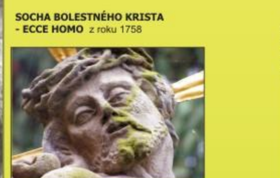
SOCHA BOLESTNÉHO KRISTA - ECCE HOMO z roku 1758