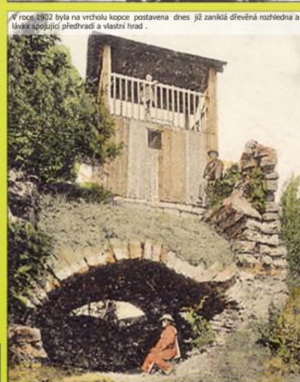
Okolo 1892 byla na vrcholu kopce postavena dnes již zaniklá dřevěná nahraděná a lázeň spojená přechodní a vlastní hrad.