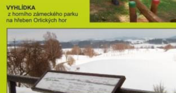
VYHLÍDKA z horního zámečkého parku na hřeběn Orlických hor