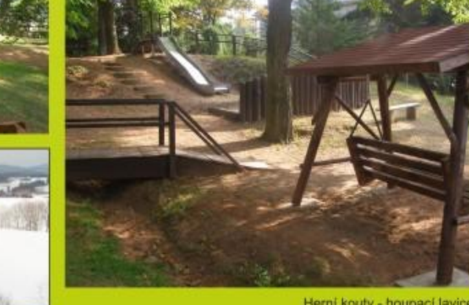
HERNÍ KOUTKY - HOUPACÍ LÁVKA