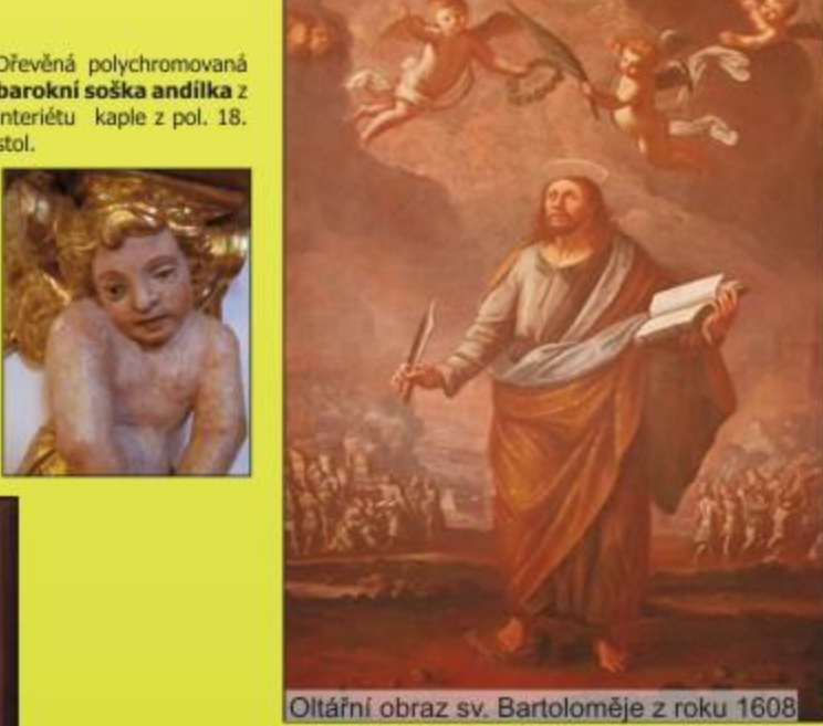
Dřevěná polychromovaná barokní soška andělka z interiéru kaple z pol. 18. stol.