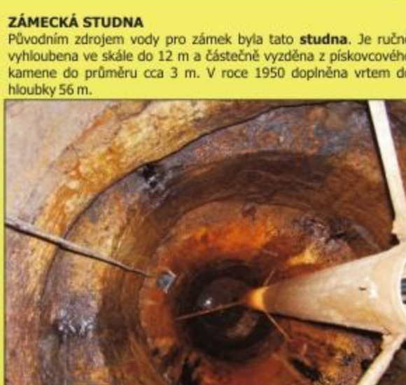
ZÁMEČKÁ STUDNA Původním zdrojem vody pro zámek byla tato studna . Je ručně vyhloubena ve skále do 12 m a částečně vyzděna z pískovcového kamene do průměru cca 3 m. V roce 1950 doplněna vrtem do hloubky 56 m.