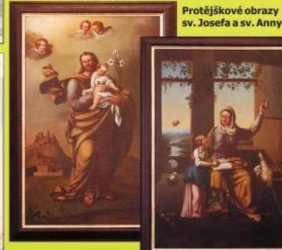
Protějčkové obrazy sv. Josefa a sv. Anny.