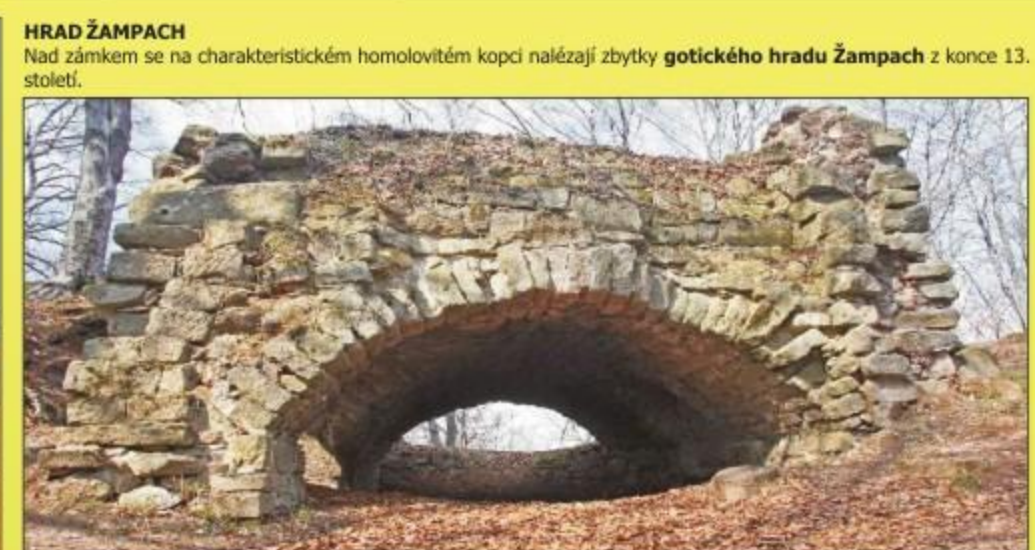
HRAD ŽAMPACH Nad zámek se na charakteristickém homolovitě kopci nalézají zbytky gotického hradu Žampach z konce 13. století.