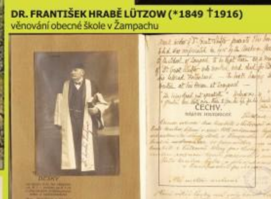
DR. FRANTIŠEK HRABĚ LÜTZOW (*1849 †1916) věnování obecné škole v Žampachu