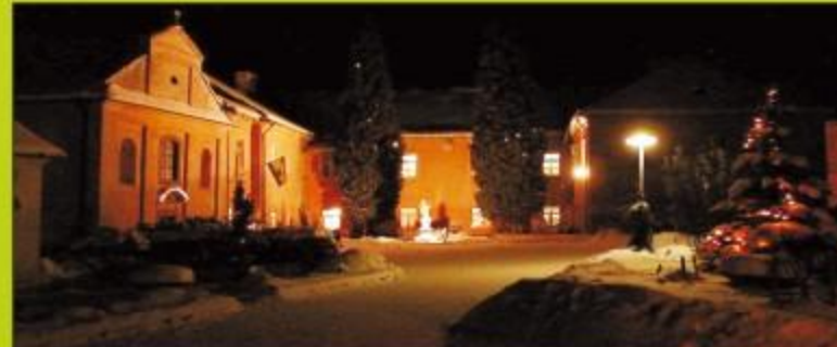
ZÁMEK ŽAMPACH Původně tvrz doležená před rokem 1600 pod hradem Žampach, roku 1672 přistoupili jezuité k výstavbě rezidence. Jako stavební materiál byl použit kámen z hradu. V r. 1701 - 1713 byla k severnímu zámečkému křídlu přistavěna raně barokní kaple sv. Bartoloměje. Po stavebních úpravách z 18. a 19. stol. získala budova zámku postupně dnešní podobu ve tvaru písmene E.