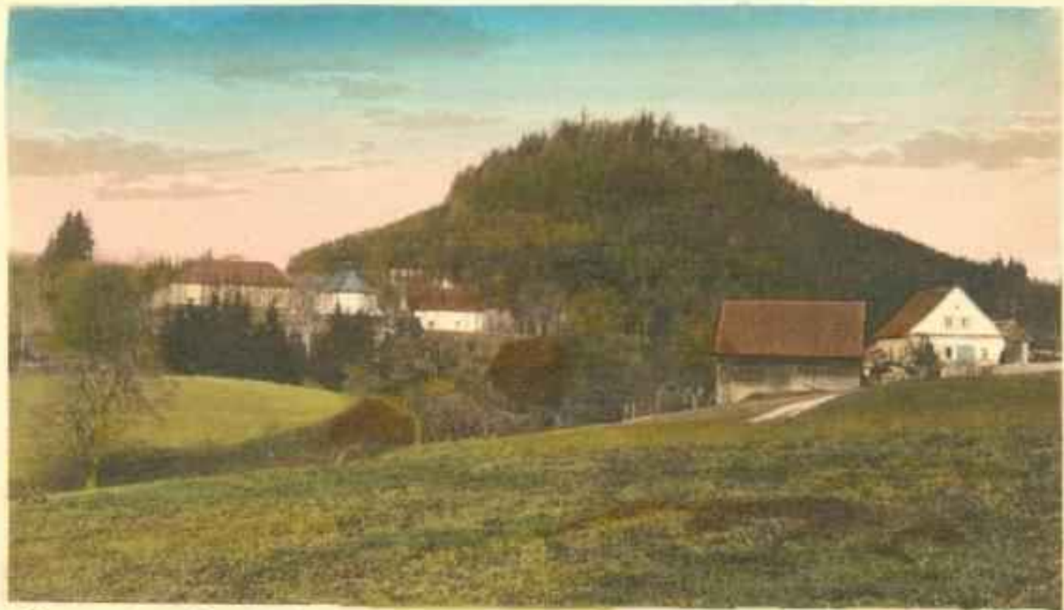
Kampach u Kamberska